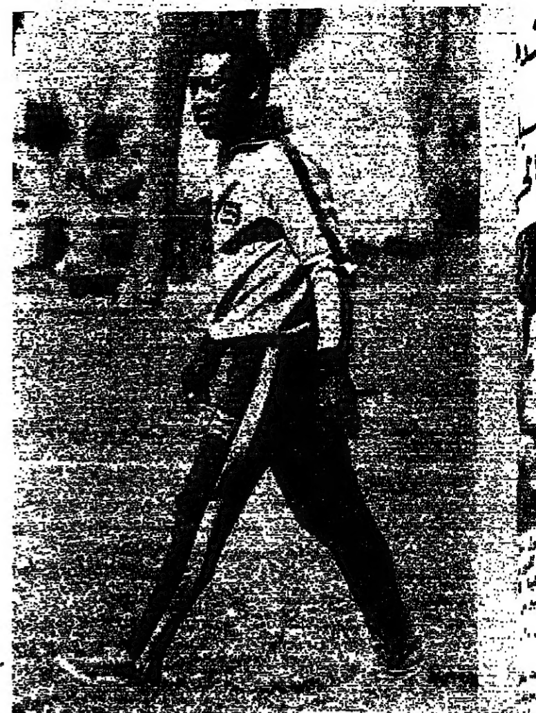
بيليه « الملك » ينزل الى أرض الملعب